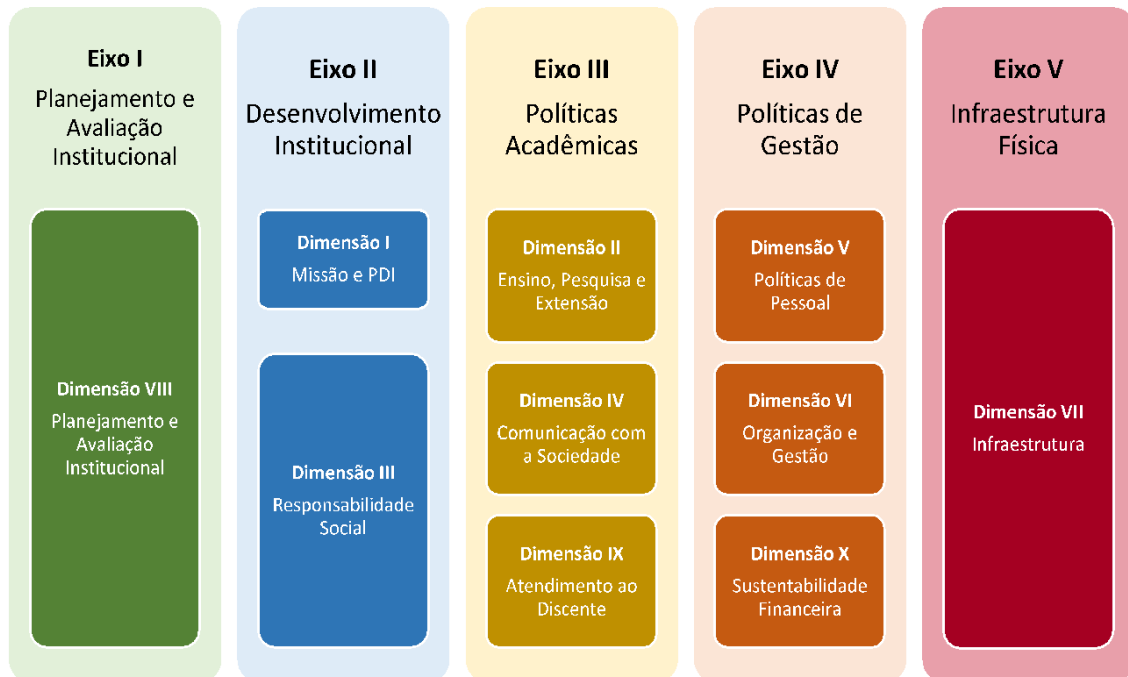
Figura 2 – Eixos e dimensões do SINAES